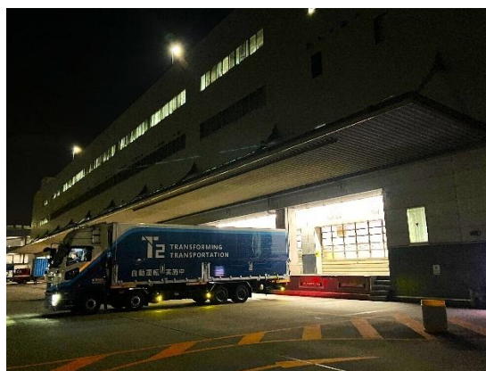
川崎東郵便局に到着した T2 の自動運転トラック

両社では、今後、こうした中継輸送での自動運転トラックの活用に継続して取り組みます。そして、有効性を確認できれば定期的な運行への移行を検討し、レベル 4 に必要なオペレーションの構築に向けた連携をさらに深めてまいります。