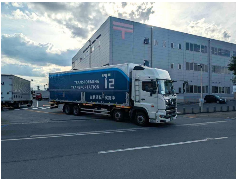
日本郵便 熊本北郵便局から T2 のコンテナを積んだ日本郵便のトラックが発発する様子

本取り組みでは、T2 が 2027 年度以降に開始を目指すレベル 4*1自動運転トラックによる幹線輸送を見据えて、無人/有人運転を切り替える拠点（以下「切替拠点」）で T2 の自動運転トラックと日本郵便の通常のトラックの間でコンテナを移し替えるオペレーションも初めて検証しました。