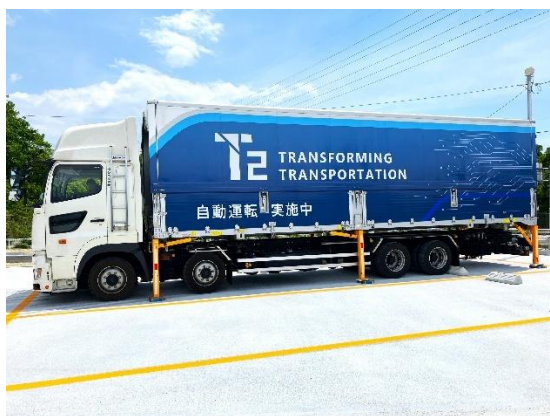
トランスゲート神戸西でコンテナを移し替える様子