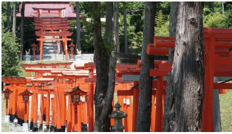
福島：高屋敷稲荷神社

ィへの投稿、そして現地での実際の体験。ぜひそれぞれの形で「やすらぎのパワースポット」をお楽しみください。次の旅先が、きっと見つかるはずです。